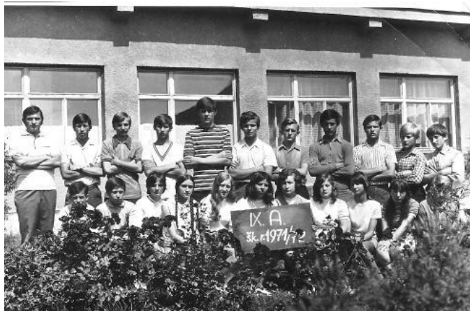
Takto sme vyzerali v roku 1971