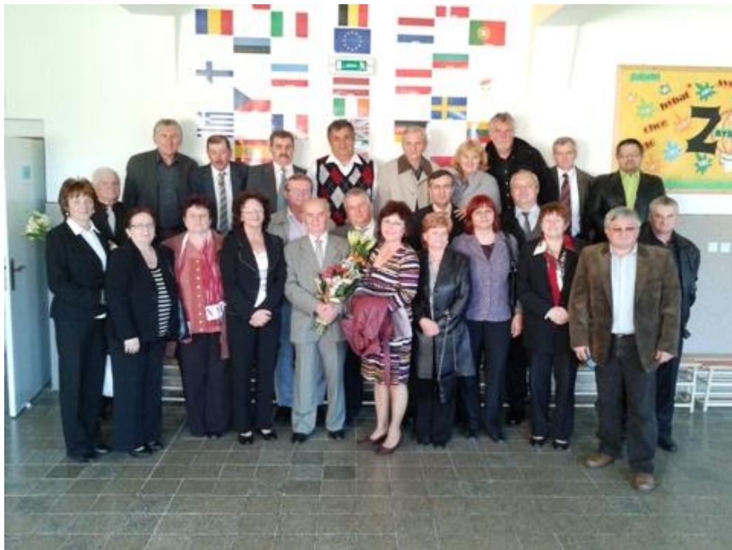
Ani sme sa za tie roky nezmenili - takto vyzeráme dnes