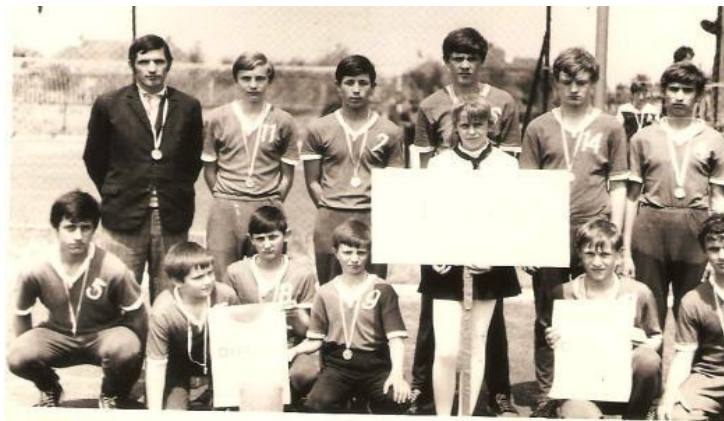
Naši volejbalisti - majstri Slovenska