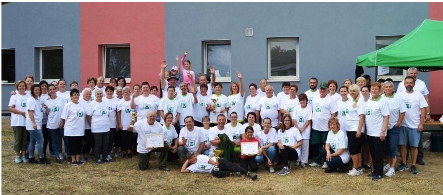
Výstup na Šimonku

Dňa 31. augusta pri príležitosti 75. výročia SNP usporiadala obec Bystré v spolupráci s obcami Hermanovce nad Topľou a Čierne nad Topľou, Agrodružstvom Bystré a firmou Zeocem a. s. Bystré v poradí už 39. ročník výstupu na Šimonku. Stretnutie začalo o 9.00 hodine ráno pietnym aktom kladenia vencov pri pamätníku. Počasie nám prišlo a slniečko nás zohrievalo svojimi teplými lúčmi. Veselými krokmi sme kráčali vyznačenou trasou, ktorú už mnohí z nás veľmi dobre poznajú. Cesta spolu s priateľmi nám ubieha veľmi rýchlo a asi po dvojhodinovej túre sme sa dostali na samotný vrchol Šimonky. Po zapísaní účastníkov výstupu do pamätnej knihy a odovzdaní vlajok, ktoré nám budú pripomínať tento deň, sme si spoločne posedeli na lúke, kde sme sa pri ohníku posilnili pečenými klobáskami, slaninkou a inými dobrotami. Po načerpaní novej energie sme pomaly vykročili naspäť ku chate Mjr. Kukorelliho, kde nás čakal chutný guláš. Veríme, že sa na najvyššom vrchu Slanských vrchov stretneme aj o rok.