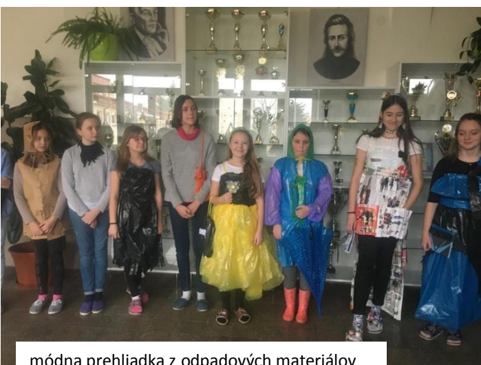
módna prehliadka z odpadových materiálov

Za získané peniaze nakúpime knihy do školskej knižnice. Vianočná akadémia je miestom, kde vám spoločne s mladšími kamarátmi z materských škôl chceme priniesť trochu vianočnej atmosféry a potešiť vaše srdcia.