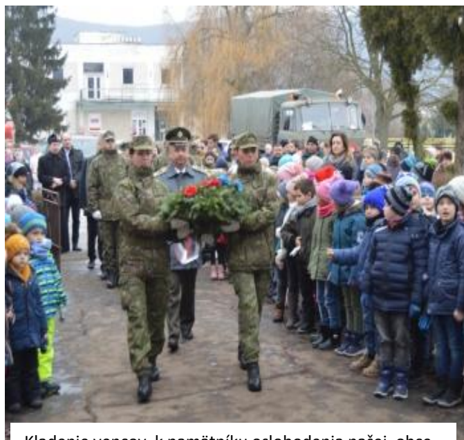
Kladenie vencov k pamätníku oslobodenia našej obce