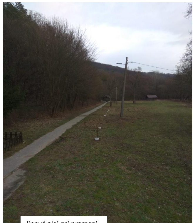
lipová alej pri prameni