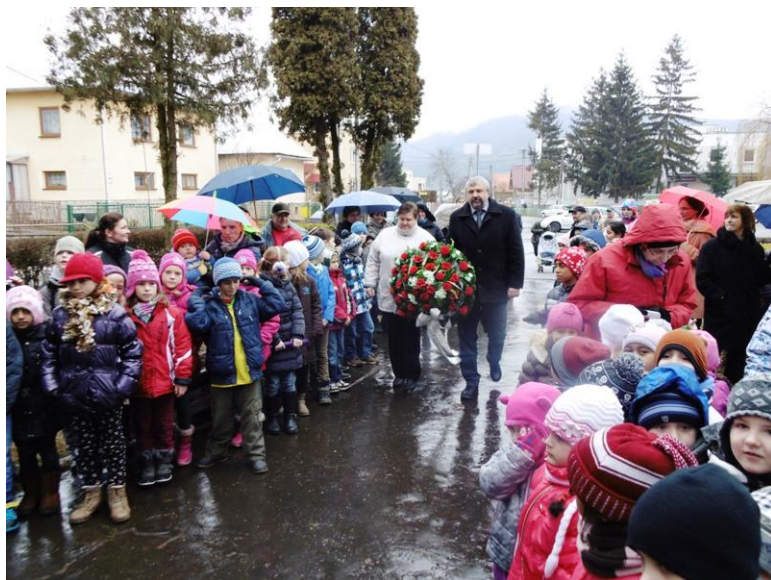
Kladenie vencov - 70. výročie oslobodenia našej obce